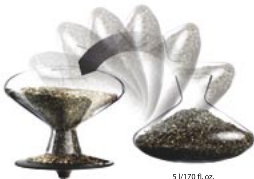
5 1/170 fl. oz.

Hvis det er muligt, kan du med fordel opstille flere foderbrætter med hvert deres indhold på forskellige steder i haven.